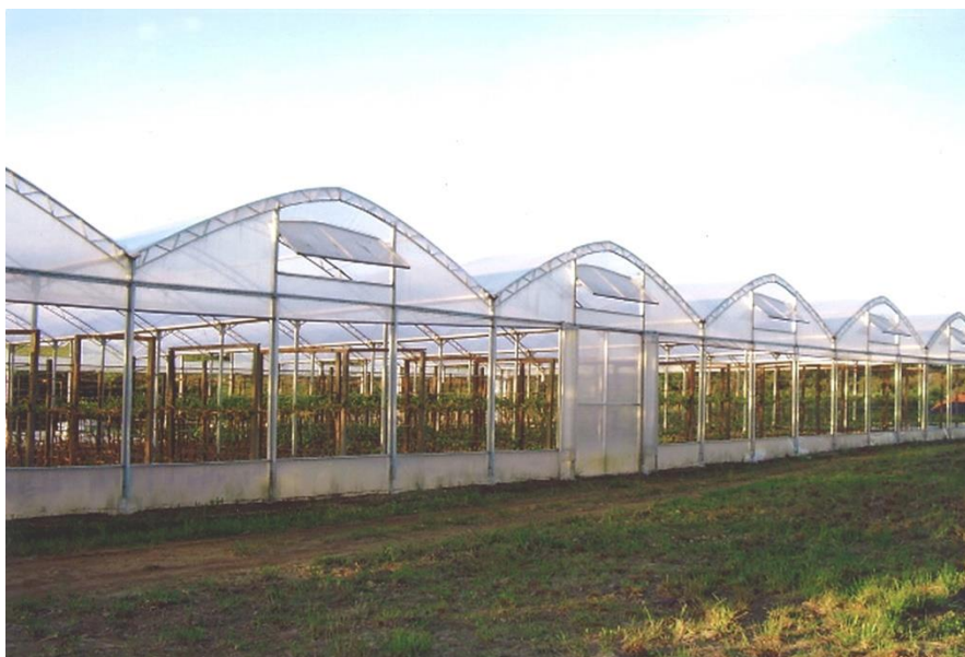
Figura 2. Foto ilustrando a estufa no qual as variedades Cabernet franc e Merlot foram cultivadas.

Realizou-se um experimento fatorial 2x2 em delineamento inteiramente casualizado com seis repetições, considerando uma planta de videira como unidade experimental. Os tratamentos consistiram na combinação de duas cultivares (Merlot e Cabernet franc) e as duas alturas de condução (0,5 e 1,5m). A poda utilizada em todas as plantas do experimento foi à poda curta com no mínimo duas gemas francas por esporão. As demais práticas de manejo foram iguais a todas as parcelas do experimento.