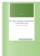
Rev Agr Acad v2 n2 2019 157p by Agrarian Academic Journ... Published 1 year ago