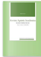
Rev Agr Acad v2 n5 2019 185p by Agrarian Academic Journ... Published 8 months ago