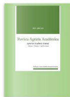
Rev Agr Acad v2 n1 2019 161p by Agrarian Academic Journ... Published 1 year ago