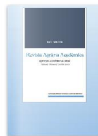
Rev Agr Acad v1 n3 2018 106p by Agrarian Academic Journ... Published 2 years ago