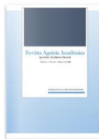
Rev Agr Acad v1 n1 2018 92p by Agrarian Academic Journ... Published 2 years ago