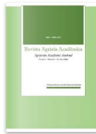
Rev Agr Acad v2 n6 2019 212p by Agrarian Academic Journ... Published 1 month ago