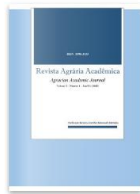
Rev Agr Acad v3 n1 2020 162p by Agrarian Academic Journ... Published 1 month ago