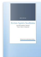
Rev Agr Acad v1 n2 2018 106p by Agrarian Academic Journ... Published 2 years ago