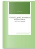
Rev Agr Acad v2 n3 2019 221p by Agrarian Academic Journ... Published 11 months ago