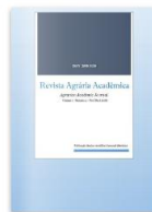
Rev Agr Acad v1 n4 2018 112p by Agrarian Academic Journ... Published 2 years ago