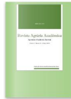
Rev Agr Acad v2 n4 2019 254p by Agrarian Academic Journ... Published 10 months ago