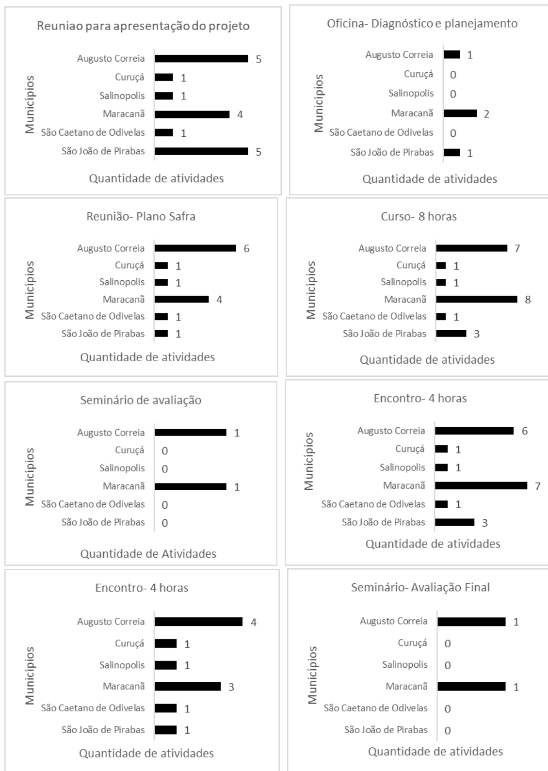
Figura 3 - Atividades coletivas realizadas na assistência técnica e extensão rural na promoção da aqüicultura no Pará, Brasil.

Em relação ao crédito rural, este é um importante instrumento para o desenvolvimento econômico e financeiro dos negócios rurais, pois estimula e dinamiza os investimentos no setor agropecuário. Existem linhas de crédito para atender à aqüicultura, entretanto, esse crédito