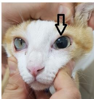
Figura 3 - Imagem evidenciando a pupila esquerda em midríase e a direita em miose de uma felina positiva para vírus da leucemia felina (FeLV), sugestivo de alteração neurológica associado esta infecção viral.

A fêmea positiva para FeLV apresentou um sinal clínico neurológico (anisocoria) que segundo a literatura alguns gatos infectados por este vírus podem apresentar (Figura 3). O animal mesmo com esta possível alteração neurológica decorrente do vírus, permanecia sem alteração clínica (NELSON; COUTO, 2015).