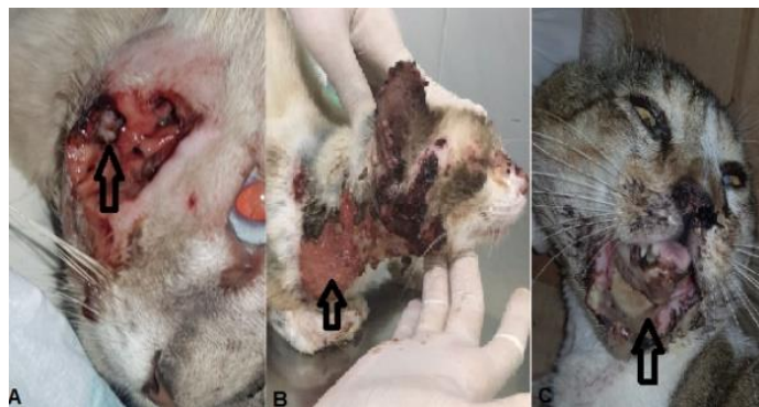
Figura 2 - Imagens de felinos positivos para o vírus da FIV e/ou FeLV com doenças concomitantes. A) Imagem evidenciando miíase em uma infecção de pele de um felino. B) Imagem evidenciando infecção de pele causada pela esporotricose. C) Imagem demonstrando lábio inferior de um felino solto da mandíbula com infecção bacteriana.