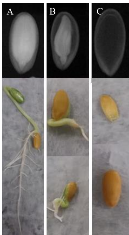
Figura 2 - Semente cheia e plântula normal após a germinação (A), semente mal-formada e plântula anormal após a germinação (B), semente vazia e semente não germinada (C), de frutos de melão amarelo, cultivar Anton.

O uso de raios X é ferramenta viável na classificação da qualidade fisiológica das sementes de melão, sendo confirmado pelo resultado do teste de germinação. A técnica de obtenção de imagens é precisa, rápida e não destrutiva. Algumas pesquisas também evidenciaram a eficiência do uso de raios X em outras culturas: maxixe (Medeiros et al., 2010), Eugenia pleurantha (MASETTO et al., 2007) e Tecoma stans L. Juss. ex Kunth (Bignoniaceae) (SOCOLOWSKI; CICERO, 2008).