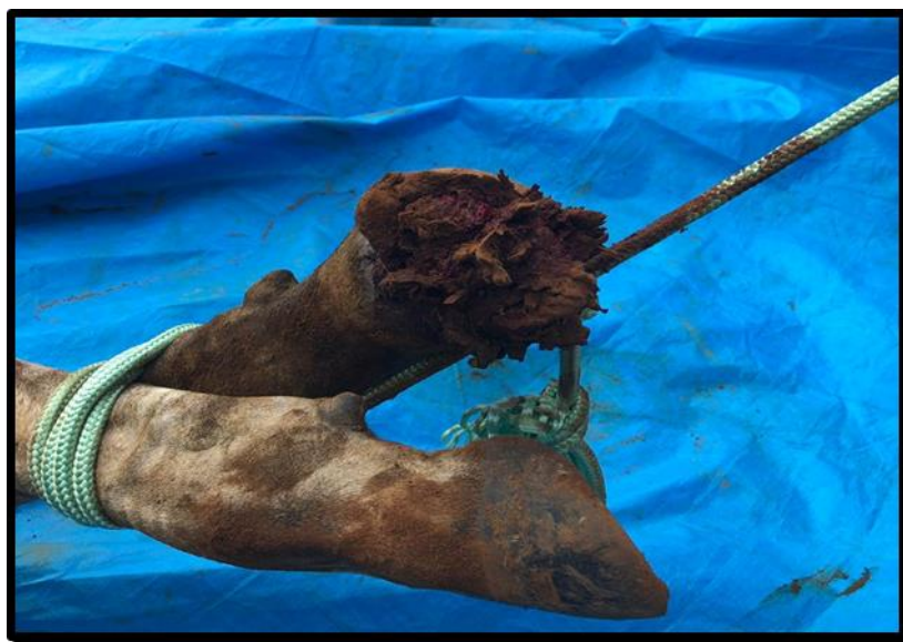
Figura 1 – Nódulo verrucoso apresentando ulcerações no membro posterior direito.

O animal foi contido em um tronco de contenção e, durante o exame físico foi constada a presença de um nódulo de característica verrucosa e ulcerado no membro posterior direito (Figura 1), foram avaliados os parâmetros fisiológicos como frequência cardíaca (FC), frequência respiratória (FR), movimentos ruminais (MR) e temperatura retal sendo constatados que os mesmos estavam dentro da normalidade.