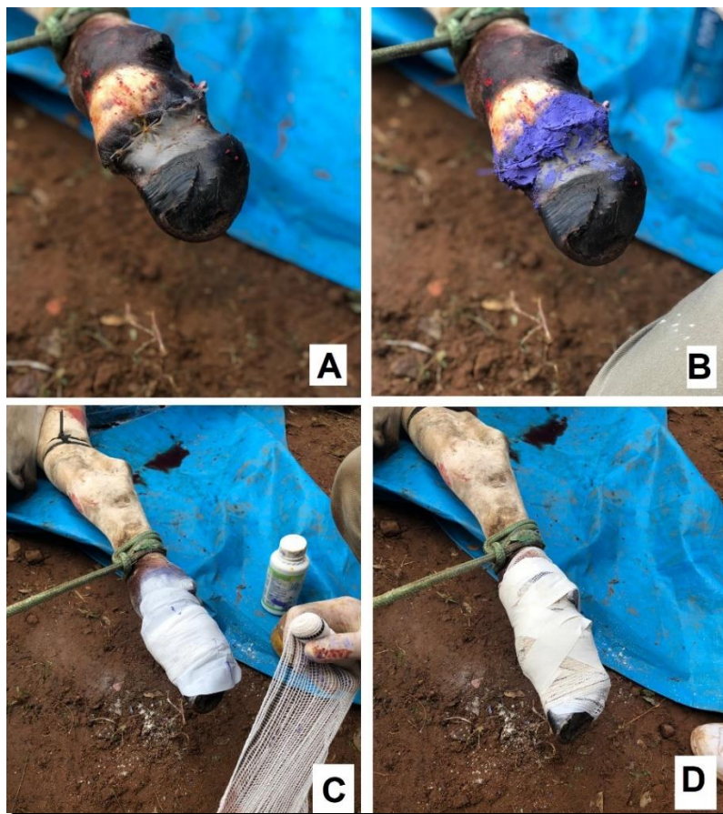
Figura 4 – Realização de sutura e bandagem do dígito amputado. Sutura do local onde foi realizado a amputação do dedo (A); aplicação de Tanidil no local suturado (B); bandagem do local com auxílio de absorvente higiênico (C); bandagem total da pata com auxílio de faixa e esparadrapo (D).

Após a extração do dígito foi usado Tanidil em pó sendo colocado no local da amputação, feito isso foi realizado a sutura com fio nylon 0,50mm agulhado em agulha 40x12, foram realizados 7 pontos simples separados. Após a sutura da pele foi passado sobre o local uma pasta por nome Unguento ® para auxílio da cicatrização e com ação repelente e sendo utilizado também o spray Prata ® . Em seguida foi realizada a atadura do local, sendo utilizado um absorvente higiênico, atadura crepe e esparadrapo para bandagem (Figura 4), posteriormente o torniquete foi aliviado lentamente. Para o pós-operatório utilizou-se 1mL/8kg totalizando 32 ml de antibiótico Penforte ® PPU (Penicilina G procaína, Penicilina G benzatina, Dihidroestreptomicina (Sulfato) e 0,04mL/kg totalizando 11 ml de Banamine ® (Flunixinina meglumina).