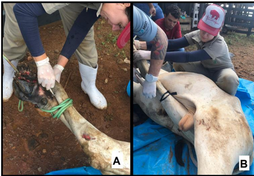
Figura 2 – Realização de tricotomia do membro posterior direito e realização do bloqueio anestésico de Bier. Tricotomia do membro posterior direito (A); realização do bloqueio anestésico de Bier (B).

Para realização do bloqueio anestésico utilizou-se um torniquete de borracha acima do joelho, feito o torniquete realizou-se a punção venosa com auxílio de uma seringa de 10 ml e agulha 40x12 retirando 5 ml de sangue, após a retirada de sangue foi administrada no mesmo local por via endovenosa 5 ml de lidocaína sem vasoconstritor injetada lentamente (Figura 2B).